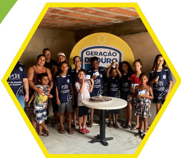
Aniversariante do mês