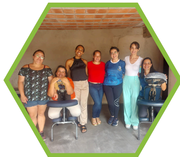
Dia da Mulher