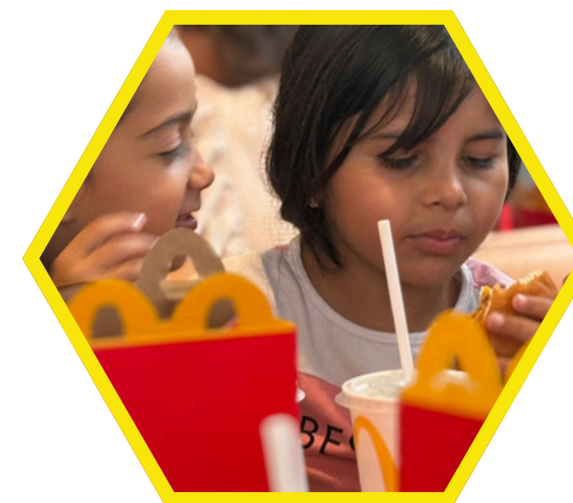
Passeio Mc Donald's