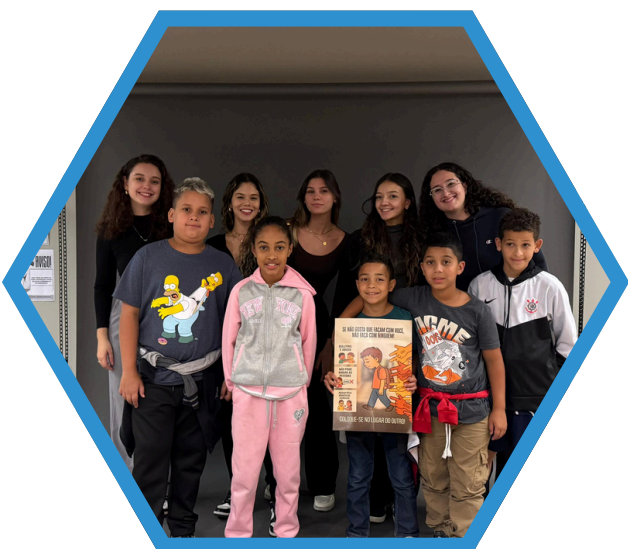
Visita Faculdade Belas Artes Sorocaba