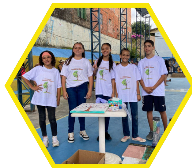
I Mostra de Arte: Planeta Terra