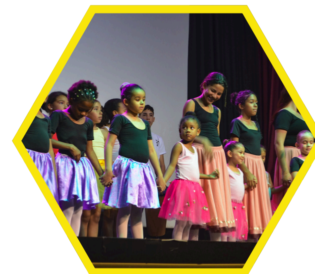
I Mostra de Arte: Eu e o Outro