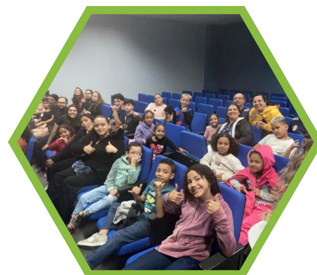
Visita Faculdade UNISO