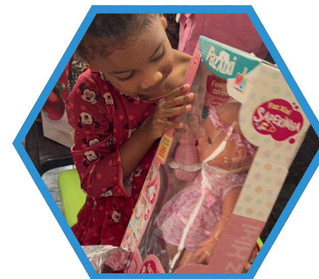
Apadrinhamento de Natal